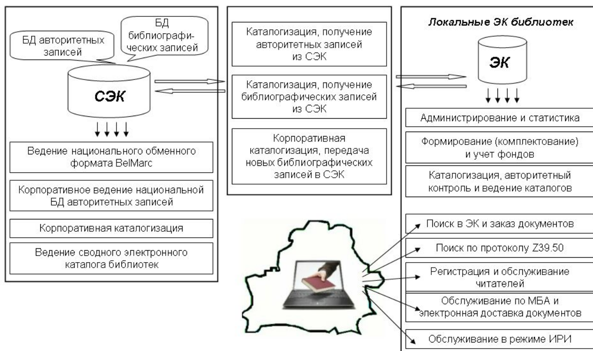
Рис. 1. Функциональная схема АБИС БИТ-2000и

К основным возможностям АБИС БИТ-2000и относятся: