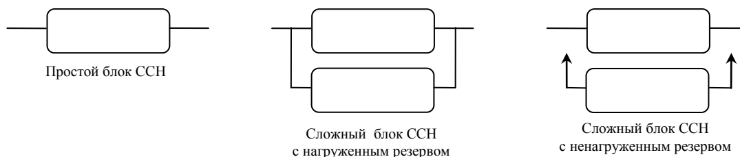
Рис. 2. Графическое представление основных блоков ССН

На рис. 2 изображены основные блоки ССН, из которых строится ССН объекта в целом.